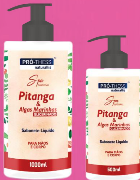
Sabonete 1000ml e 500ml