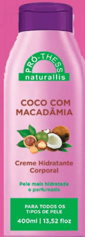
Creme Hidratante Corporal Óleo de Coco e Macadâmia - 400ml