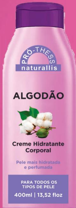
Creme Hidratante Corporal Algodão - 400ml