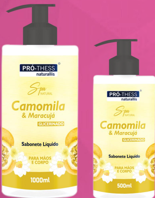
Sabonete 1000ml e 500ml