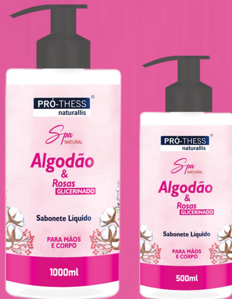
Sabonete 1000ml e 500ml