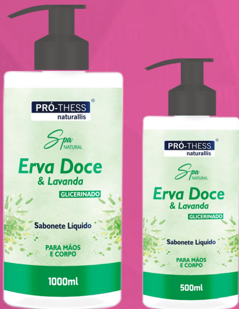
Sabonete 1000ml e 500ml