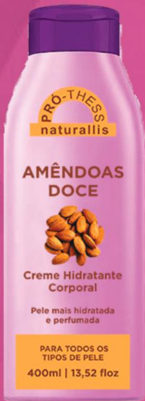
Creme Hidratante Corporal Amendoas Doce - 400ml